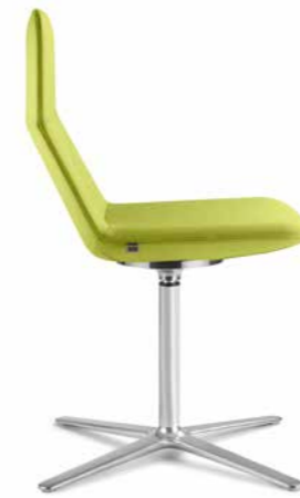
FLEXI/CHL, F25-N6 ■