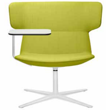
FLEXI/L, F27-N0 + TP/L-N0 ■