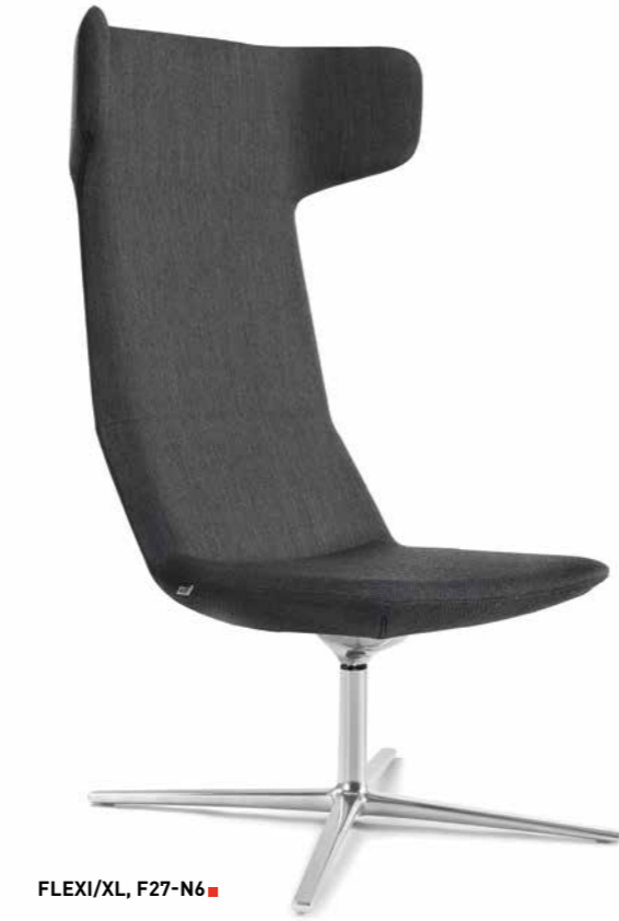
FLEXI/XL, F27-N6 ■