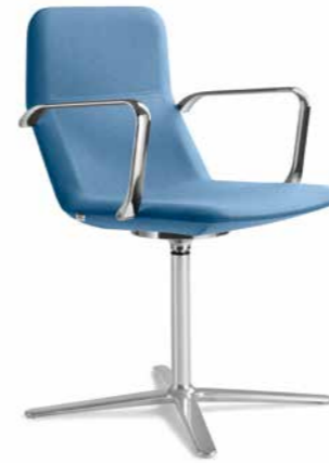
FLEXI/CHL-BR, F25-N6 ■

Modèles de conférence et de réunion Flexi / CHL dissimulent un nouveau concept innovant. Le siège subtil intègre un mécanisme assurant la flexibilité d'une partie supérieure du dossier. Cet élément augmente considérablement le confort de siège d'un utilisateur.