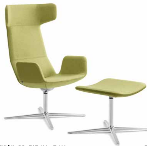
FLEXI/XL-BR, F27-N6 + T-N6 ■