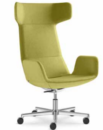
FLEXI/XL-BR, F37-N6 ■