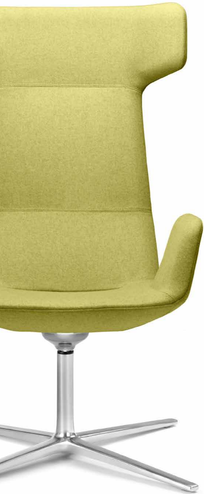
FLEXI/XL-BR, F27-N6 ■