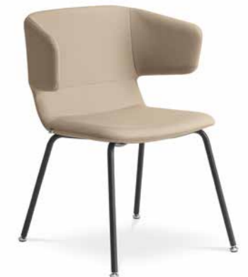
FLEXI/P, K-N1 ■