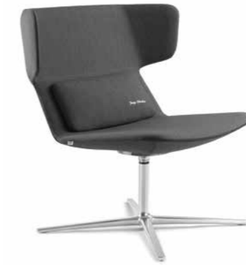
FLEXI/L, F27-N6 ■