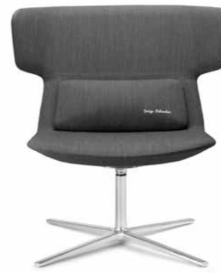
FLEXI/L, F27-N6 ■