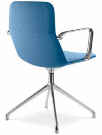
FLEXI/CHL-BR, F20-N6 ■