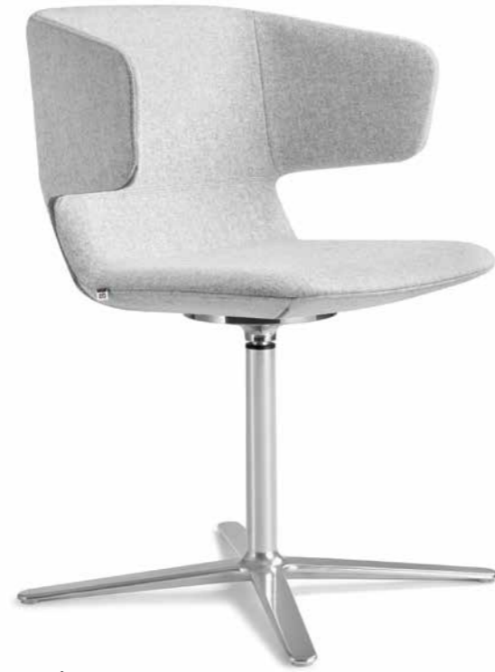
FLEXI/P, F25-N6 ■

With an in-built mechanism in the backrest to ensure the flexibility of the backrest's upper part, Flexi/CHL conference and meeting chairs introduce an innovative feature, which significantly increases the chair's comfort for users.