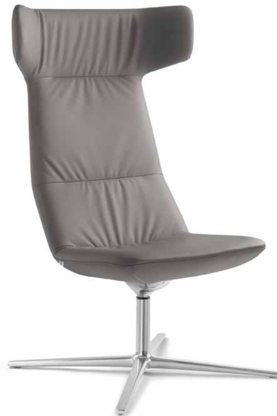
FLEXI/XL, F27-N6 ■