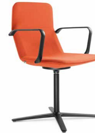
FLEXI/CHL-BR, F25-N1 ■