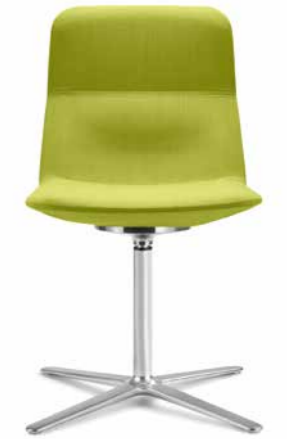
FLEXI/CHL, F25-N6 ■