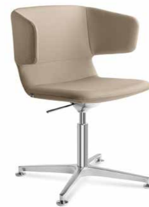
FLEXI/P-PRA, F60-N6 ■