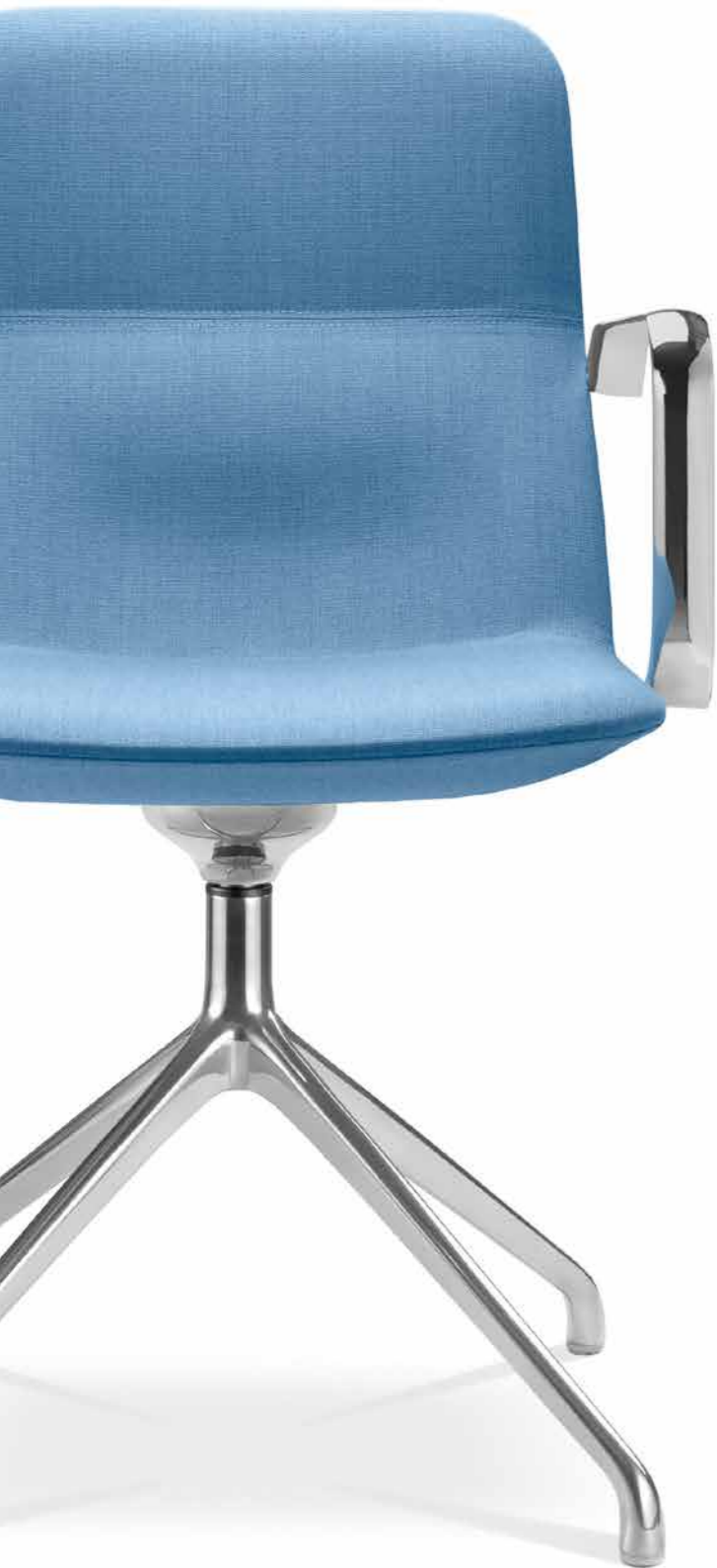
FLEXI/CHL-BR, F20-N6 ■