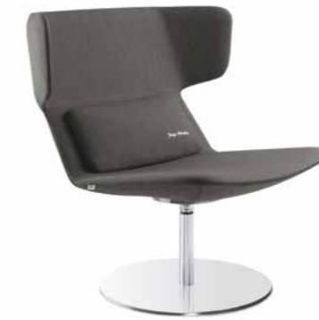
FLEXI/L, F01-N4 ■