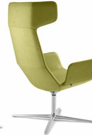
FLEXI/XL-BR, F27-N6 ■