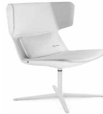
FLEXI/L, F27-N0 ■