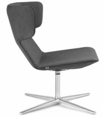
FLEXI/L, F27-N6 ■