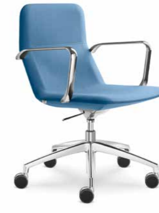
FLEXI/CHL-BR, F50-N6 ■